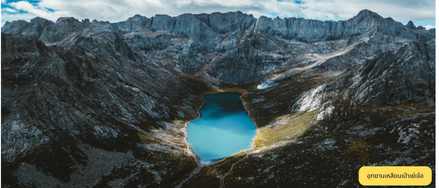
อุทยานเขลิยงเป่าเย่เจ้อ