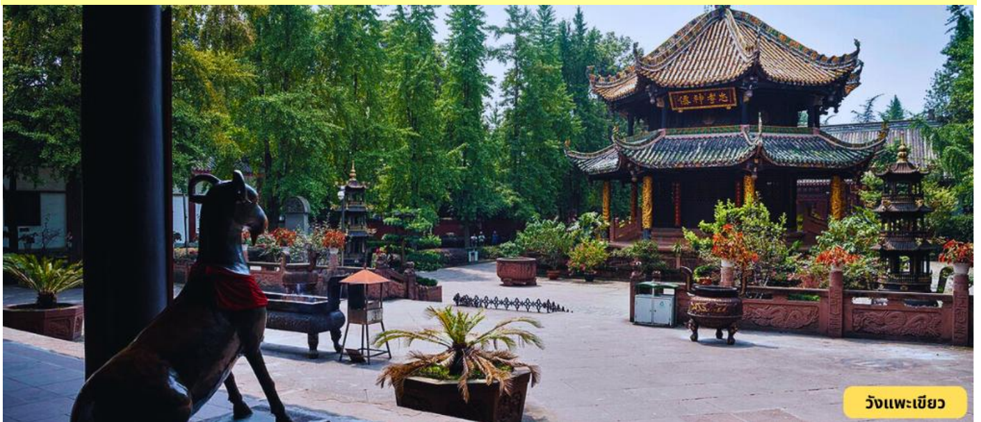
วังแพะเขียว

วังแพะเขียว - ส่งสนามบิน - กรุงเทพฯ TG619: 16.15 - 18.20 น.