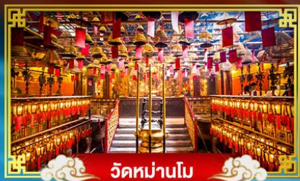
วัดมานโม

ปักใจกลาง "จิมซาจุ่ย" *บินหรือลงเทศกาลปีใหม่ ณ เกาะฮ่องกง