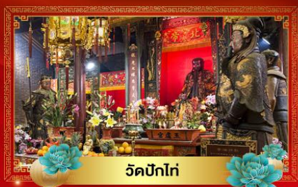
วัดบิกโท