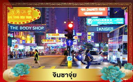
จิมซาจ๋วย