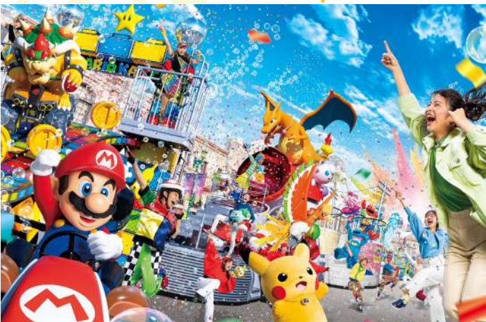
SUPER NINTENDO WORLD

นอกจากนี้ยังมีโซนยอดนิยมอื่นๆ เช่น Minion Park, Jurassic Park, Hollywood, New York และ Amity Village ที่พร้อมมอบความสูงให้กับทุกคนในครอบครัว