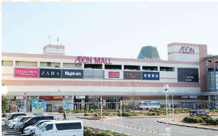
SHOPPING AT SENNAN AEON MALL

อิสระอาหารกลางวันตามอัธยาศัย (รับเงินคืนจากบัตรเครดิต 2,000 เยน)