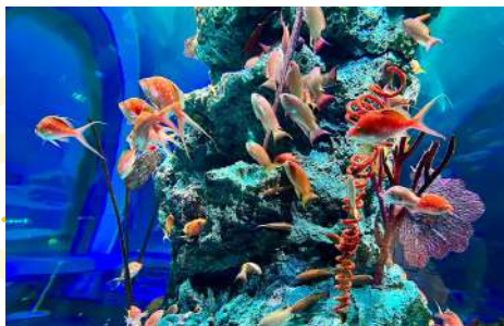
KOBE AQUARIUM ATOA