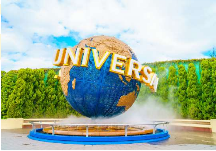
UNIVERSAL STUDIOS JAPAN