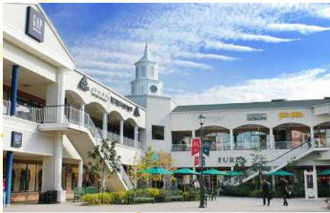
SHOPPING AT RINKU PREMIUM OUTLET