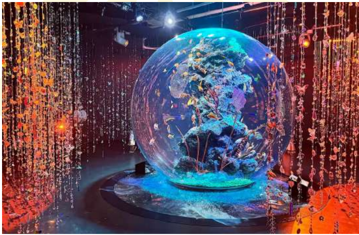
KOBE AQUARIUM ATOA