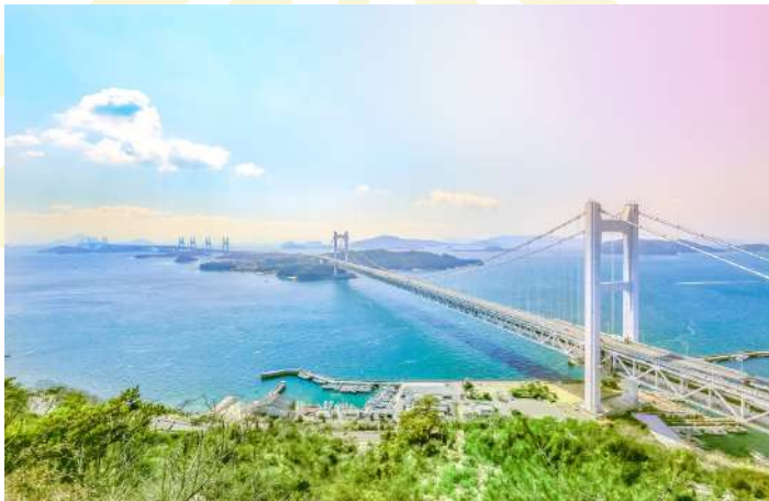
AKASHI KAIKYO BRIDGE & AWAJI HIGHWAY OASIS