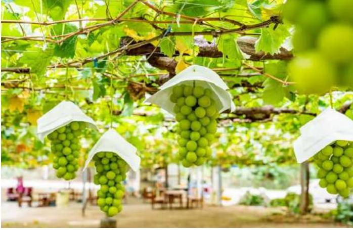
SHINE MUSCAT FARM AT KATSURAGI