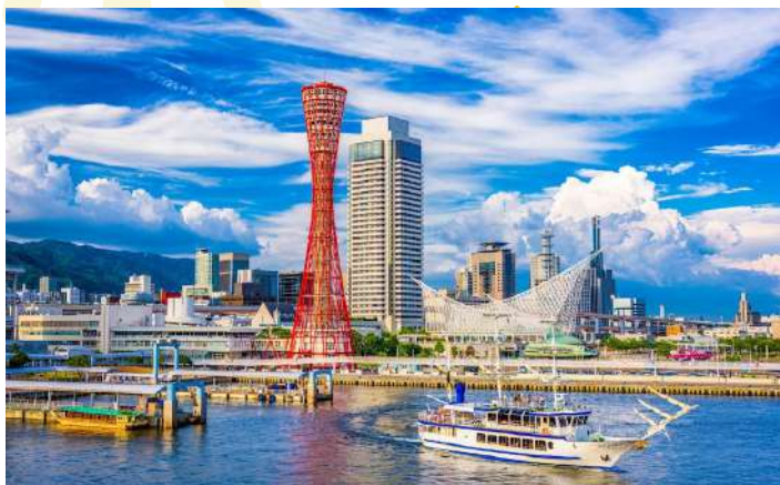
KOBE PORT TOWER