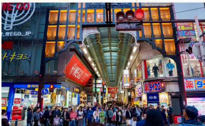
SHOPPING AT SHINSAIBASHI