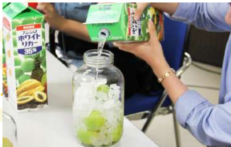
UMESHU MAKING AT NAKANO BC