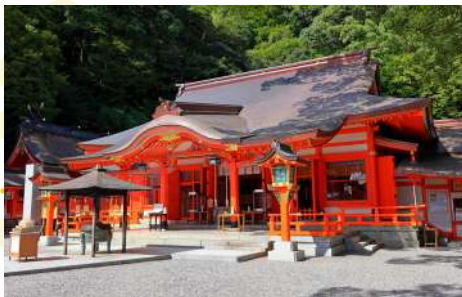
KUMANO NACHI GRAND SHRINE