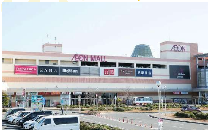
SHOPPING AT SENNAN AEON MALL