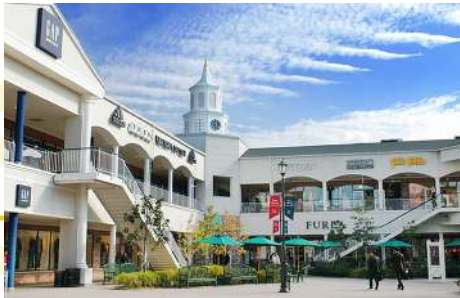
SHOPPING AT RINKU PREMIUM OUTLET