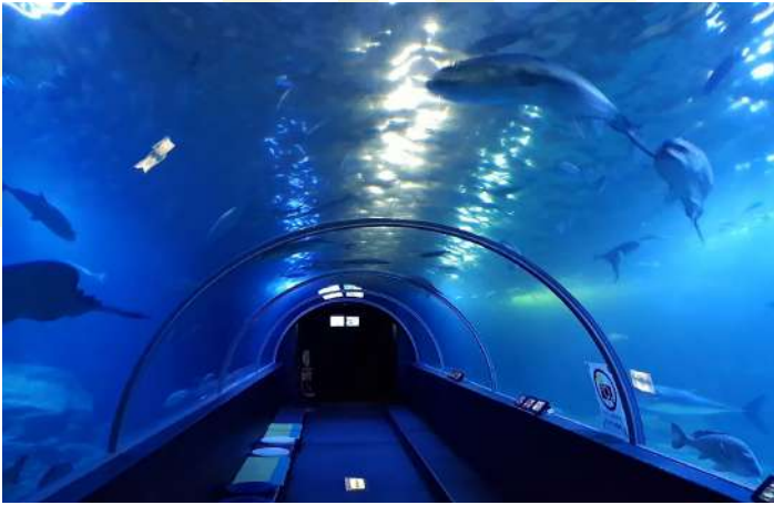
KUSHIMOTO MARINE PARK