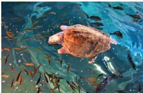
KUSHIMOTO MARINE PARK