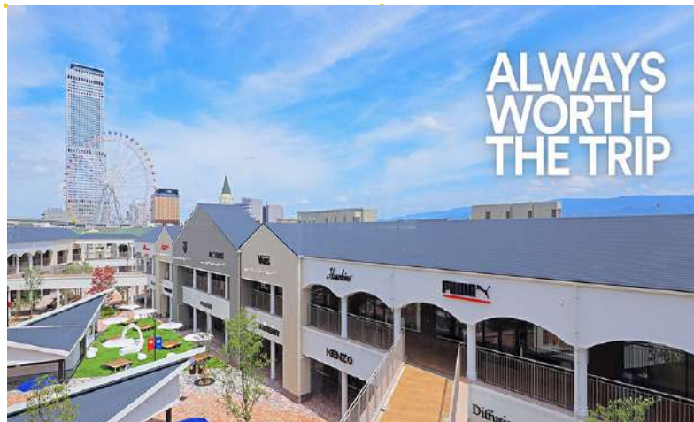
อีสาระอาหารกลางวันตามอริยาศัย (ไม่รวมในรายการ)