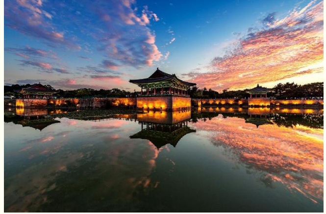
ที่พัก Lahan Select Gyeongju หรือเทียบเท่า 4 ดาว