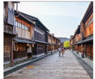
ย่านโรงน้ำชาอิงาชิยามะ

THAI สายการบินไทย บริการทุกระดับประทับใจ FULL SERVICE