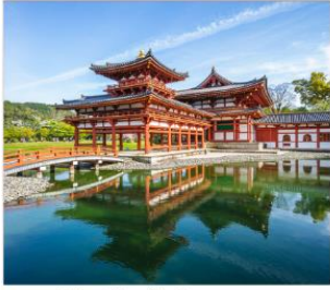
วัดเนียวโตอินและ ถนนซาเงียว