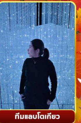
ทีมแลบโดเทียว

ออนเซ็น 2 คั้น นน.กระเป๋า 23 กก.X2 8Days 5Night