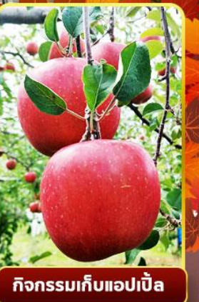
กิจกรรมเก็บแอปเปิ้ล