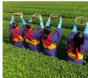
กิจกรรมเก็บชามียาโนเอ็น