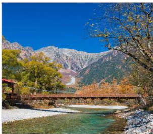
ดามิโดจิ