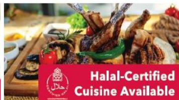
Halal-Certified Cuisine Available