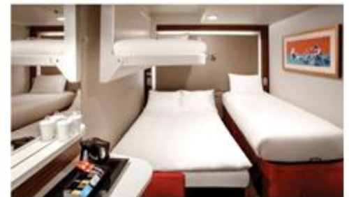
พักรม 3-4 ท่าน