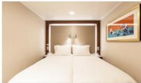
พักรม 1-2 ท่าน

From 13 - 14 sq.m Max Occupancy 2-4^ Deck 5/8/9/10/11/12/13/15 2 Single Beds / 2 Single Beds + 1 Ceiling Pullman Bed / 1 Single Bed + 1 Pullman Bed + 1 Double Sofa Bed