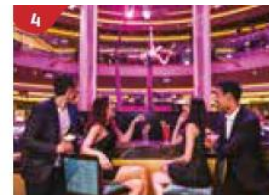
4 Bar 360 Catch live music and aerial acrobatic performances with a glass of champagne.