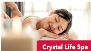
Crystal Life Spa