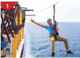
1 Ropes Course & Zipline Feel the thrill of gliding above the ocean on a 35-metre zipline.

คำวันนี้ท่านสามารถเคลียร์ค่าใช้จ่ายทั้งหมดกับทางเรือได้เพื่อความสะดวกในวันถัดไป ถ้าท่านประสงค์จะถือกระเป๋าเดินทางลงด้วยตัวเองไม่จำเป็นต้องวางไว้ที่หน้าห้องพัก