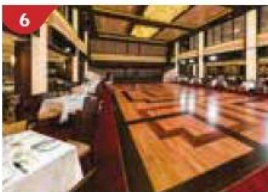
6 Dream Dining Room Savour a wide variety of Asian and international cuisine.