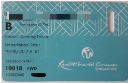
ตัวอย่างการ์ดห้องพัก