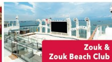
Zouk & Zouk Beach Club