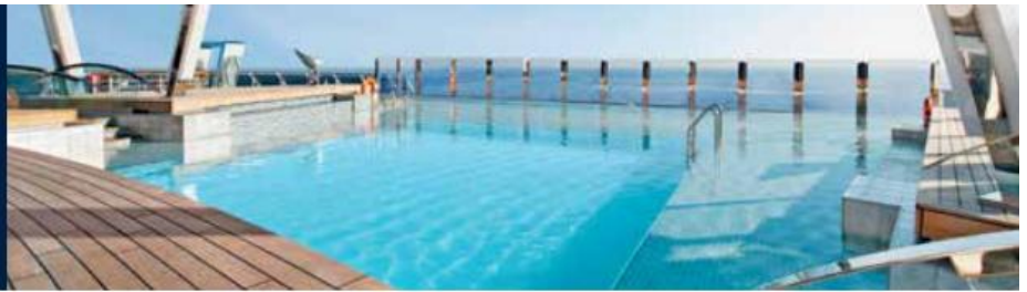
THE GARDEN POOL