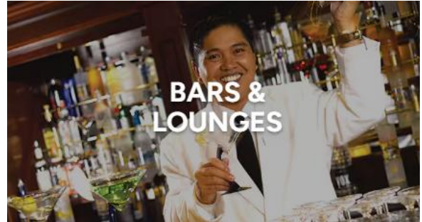
BARS & LOUNGES