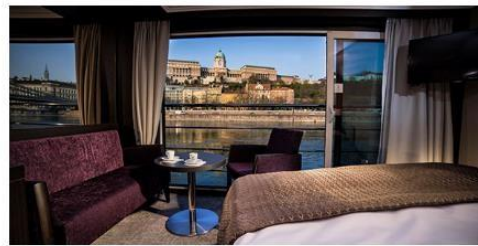
Panorama Suite 200.0 sq. ft.