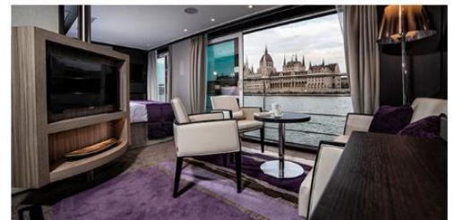
Royal Suite 300.0 sq. ft.