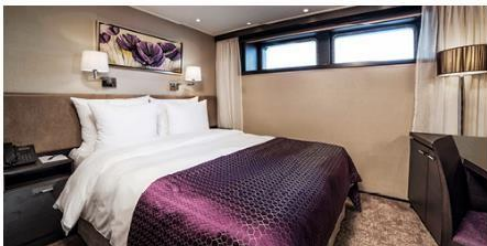
Deluxe Stateroom 172.0 sq. ft.