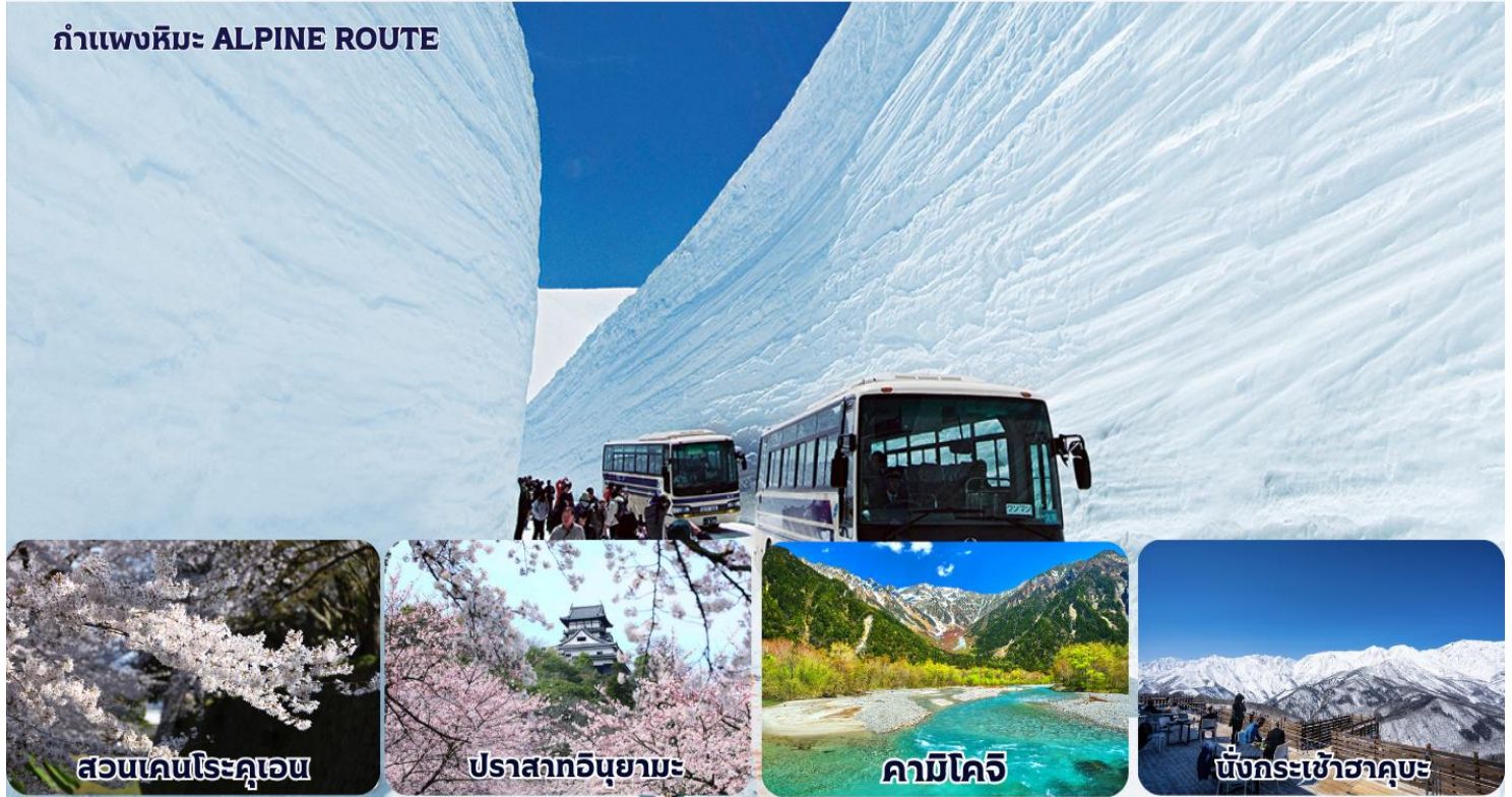
สวนเค็นโระคุเอน