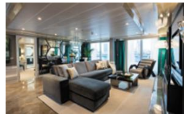
GRAND SUITE (118.6 SQM)