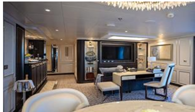
MASTER SUITE (176.1 SQM)