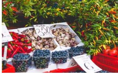
GOURMET EXPLORER TOUR