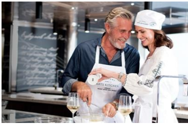
CULINARY ARTS KITCHEN