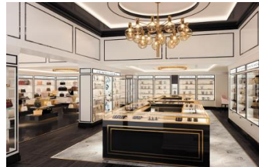
BOUTIQUES & MORE