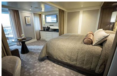
CONCIERGE SUITE /SUPERIOR SUITE (38.5-41.4 SQM)