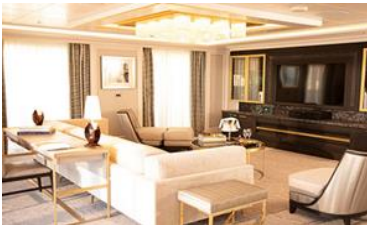
REGENT SUITE (412 SQM)