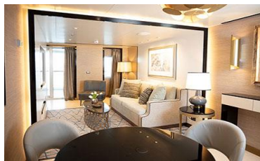
SEVEN SEAS SUITE (75.6 SQM)