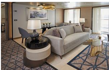
SPLENDOR SUITE (76.2 SQM)