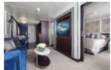
PENTHOUSE SUITE (52.1 SQM)