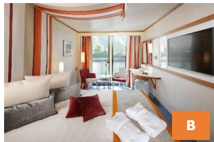
Cat. B: 2-bed outside cabin 16,5 m 2 (Deck 3)

Spacious, comfortable outside cabin. Elegant design and first-class materials ensure an atmosphere of well-being. Cabin facilities: safe, air-conditioning, TV, hair dryer, bathroom with shower and toilet, sauna towel, wool blanket,