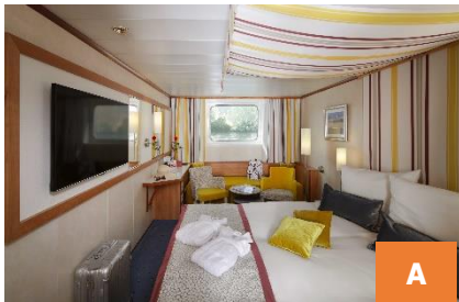
Cat. A: 2-bed outside cabin with extra bed 15,5 m 2 (Deck 1)

Spacious, comfortable outside cabin. Elegant design and first-class materials ensure an atmosphere of well-being. Cabin facilities: safe, air-conditioning, TV, hair dryer, bathroom with shower and toilet, sauna towel, wool blanket,