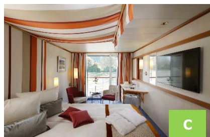
Cat. C: 2-bed outside cabin 16 m 2 (Deck 2)

Spacious, comfortable outside cabin with panorama window. Elegant design and first-class materials ensure an atmosphere of well-being. Cabin facilities: safe, air-conditioning, TV, hair dryer, bathroom with shower and toilet, sauna towel, wool blanket, telephone, bathrobe.