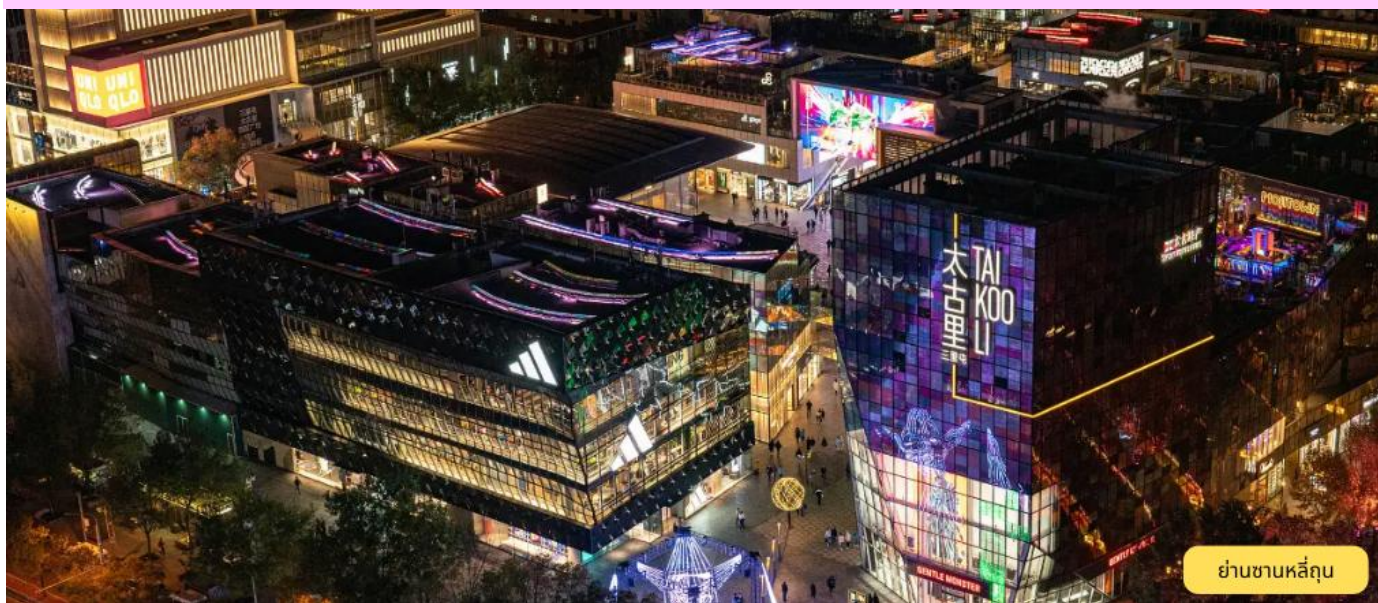
ย่านซานหลี่ถุน

ฮาร์บิ้น - นั่งรถไฟความเร็วสูงสู่ ปักกิ่ง G104 08.34-13.16 น. - ย่านซานหลี่ถุน