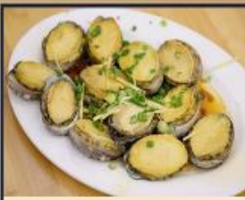
เปาฮื้อสดหนึ่ง