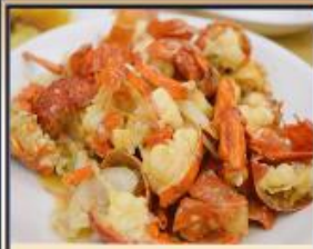
กุ้งมังกรอบซีส