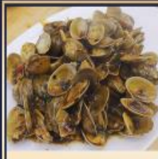
เม็ดหอยลาย