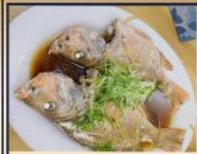
ปลาหนึ่งซีวี่