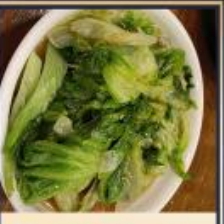
ผักผักตามฤดูกาล