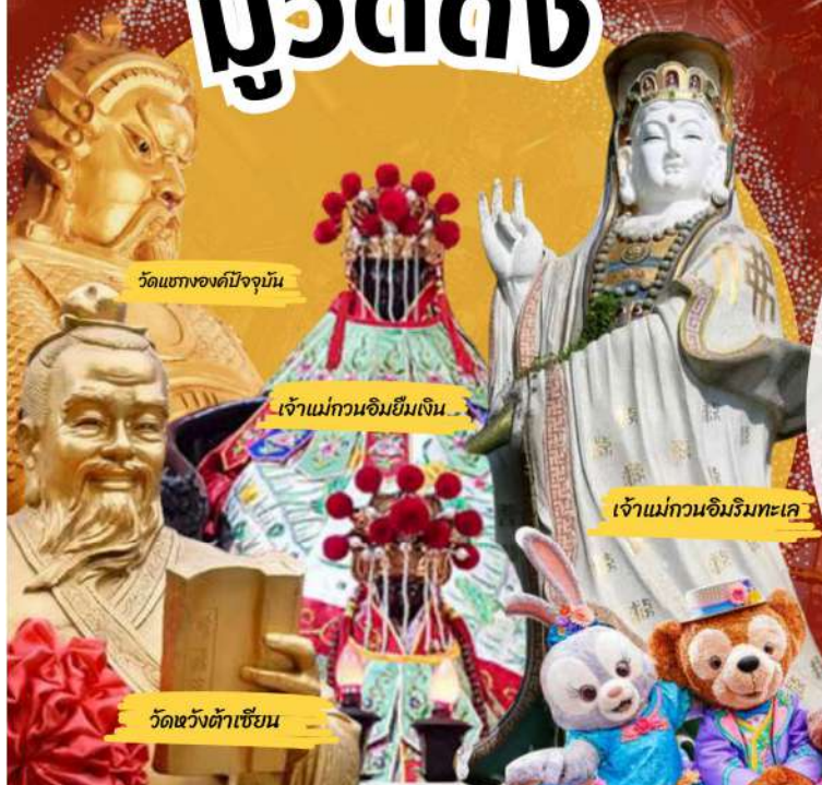
วัดแขกองค์ปัจจุบัน