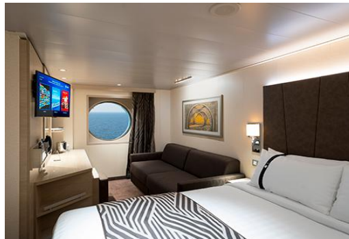
ห้องมีหน้าต่าง