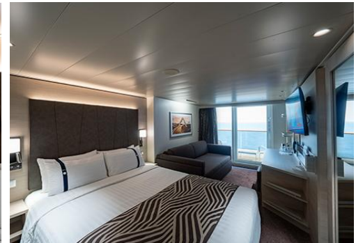
ห้องมีระเบียง