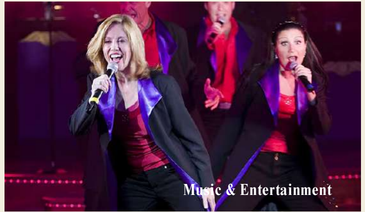
Music & Entertainment