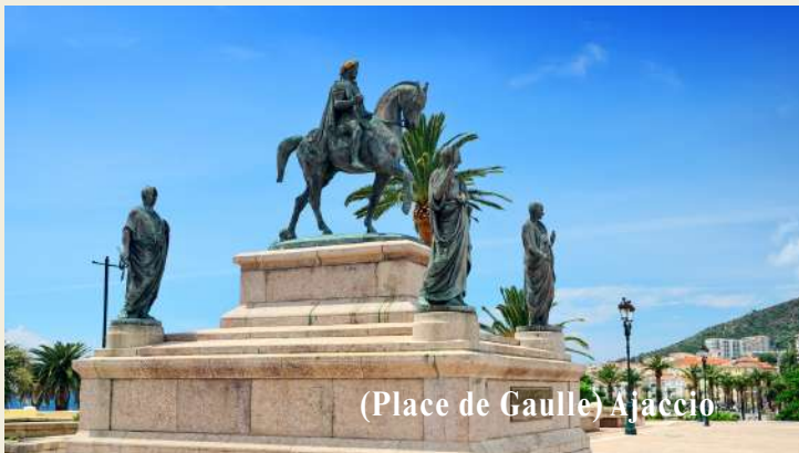
(Place de Gaulle) Ajaccio