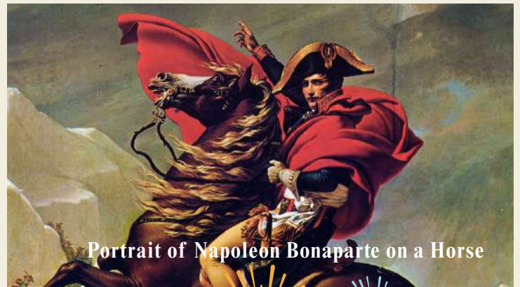
Portrait of Napoleon Bonaparte on a Horse

วันที่สิบสอง : 31 ธ.ค. 69 บาร์เซโลนา สเปน - เรือสำราญ OCEANIA