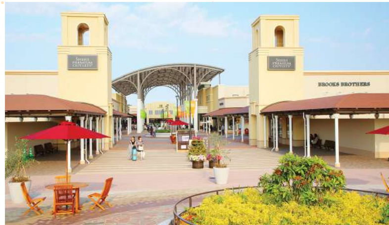
อีสรอาหารกลางวันตามอริยาศัย (ไม่รวมในรายการ)