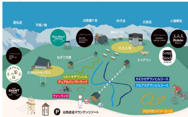
HAKUBA IWATAKE MOUNTAIN