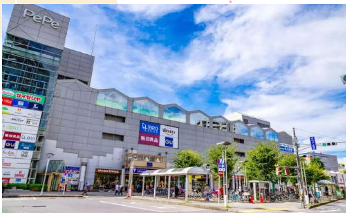
SHOPPING AT SHINJUKU