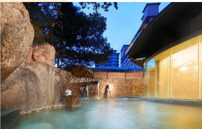
GERO HOT SPRINGS HOTEL SUIMEIKAN

“เกโระ ออนเซ็น” เป็นหนึ่งในสามบ่อน้ำพุร้อนที่ดีที่สุดของญี่ปุ่น ตั้งอยู่ในจังหวัดกิฟุ มีชื่อเสียงโด่งดังมายาวนานหลายศตวรรษในฐานะ “บ่อน้ำแห่งความงาม” หรือ “Bijin no Yu” เนื่องจากน้ำแร่บริสุทธิ์ของที่นี่มีสรรพคุณช่วยบำรุงผิวพรรณให้เนียนนุ่ม เมืองออนเซ็นแห่งนี้ตั้งอยู่ริมแม่น้ำอิดีะ รายล้อมด้วยทิวทัศน์ธรรมชาติอันงดงาม