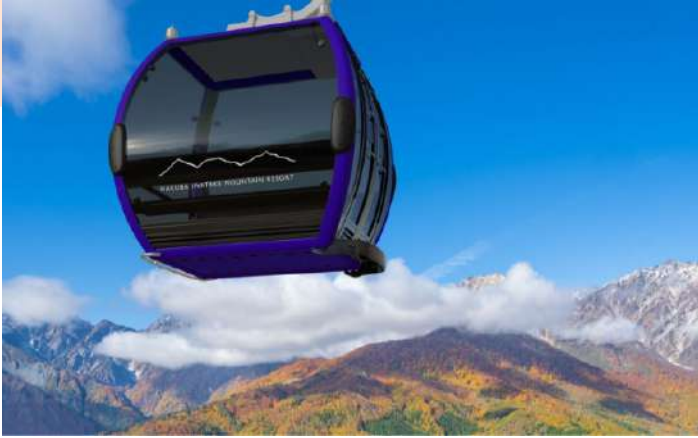
HAKUBA IWATAKE MOUNTAIN