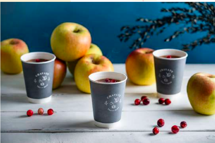
HAKUBA IWATAKE MOUNTAIN