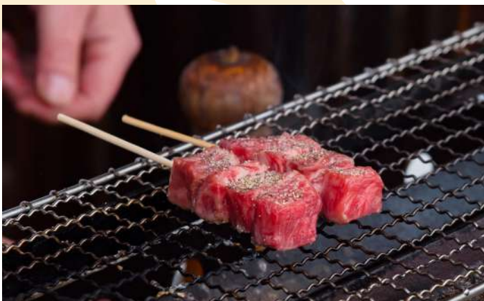
HIDA BEEF GRILLED

พิเศษสุด! เชิญทุกท่านสัมผัสรสชาติ “เนื้อฮิระอย่าง” สุดยอดเยี่ยมเรื่องชื่อของญี่ปุ่น โดดเด่นด้วยไขมันลายหินอ่อนที่แทรกซึมในทุกอนุ เมื่อนำมาย่างไฟอ่อนๆ จะส่งกลิ่นหอมกรุ่น เนื้อนุ่มชุ่มฉ่ำแทบละลายในปาก มอบคุณประสบการณ์ความอร่อยให้ท่านได้ลิ้มลอง ฟรี! (ท่านละ 1 ไม้)