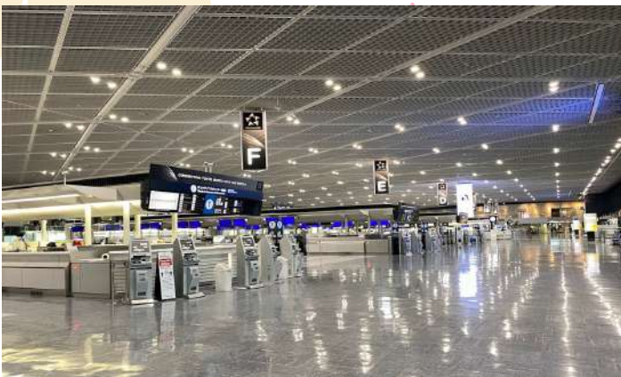
NARITA INTERNATIONAL AIRPORT

“ สนามบินนานาชาตินาริตะ ” เป็นสถานที่ที่นักท่องเที่ยวส่วนใหญ่จะได้สัมผัสเป็นที่แรกหลังจากมาถึงญี่ปุ่น ที่นี่เป็นสนามบินที่ทันสมัย สะดวกสบาย และได้รับการออกแบบมาเป็นอย่างดี อาคารผู้โดยสารหลักสองแห่งมีทั้งร้านค้า ร้านอาหาร พื้นที่นั่งรอสุดผ่อนคลาย หอชมทิวทัศน์ และกิจกรรมต่างๆ ที่จะช่วยให้คุณเพลิดเพลินอยู่ตลอด