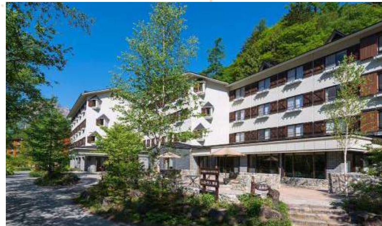
KAMIKOCHI LEMEIESTA HOTEL