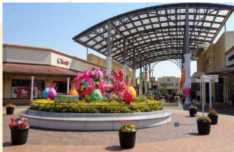
SHOPPING AT SHISUI PREMIUM OUTLETS