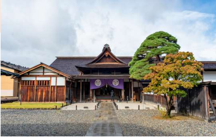
OLD GOVERNMENT TAKAYAMA