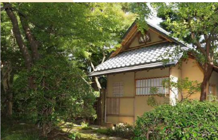
TEA CEREMONY AT SUIKOAN