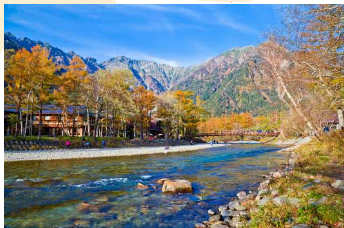
KAMIKOCHI SWITZERLAND OF JAPAN