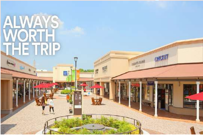
SHOPPING AT SHISUI PREMIUM OUTLETS