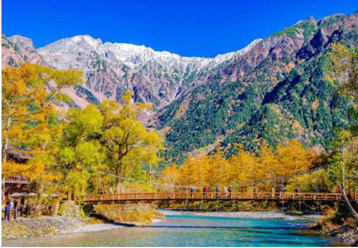
KAMIKOCHI SWITZERLAND OF JAPAN