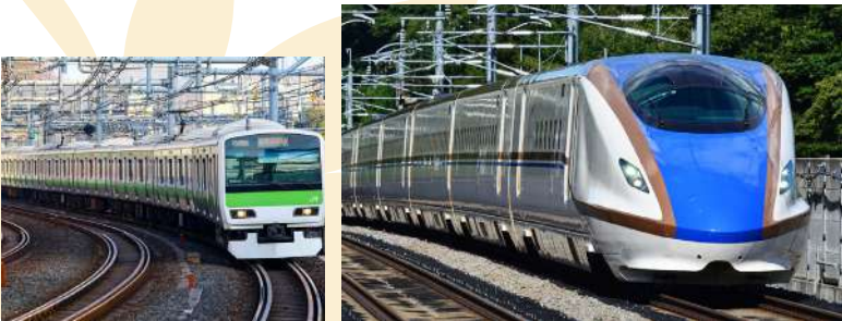
TAKE BULLET TRAIN

เดินทางด้วย “รถไฟชินคันเซ็น” ไปยัง “สถานีรถไฟโอมิยะ” เป็นการเดินทางที่รวดเร็ว สะดวกสบาย และปลอดภัยรถไฟชินคันเซ็นเป็นรถไฟความเร็วสูงของญี่ปุ่น มีความทันสมัยและมีเทคโนโลยีที่ล้ำสมัย ทำให้การเดินทางของคุณเป็นไปอย่างราบรื่นและถึงที่หมายตรงเวลา จากนั้นเปลี่ยนขบวนรถไฟเป็น “รถไฟท้องถิ่น” เพื่อมุ่งหน้าสู่ “สถานีรถไฟชินจูกุ”