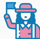
มัคคุเทศก์