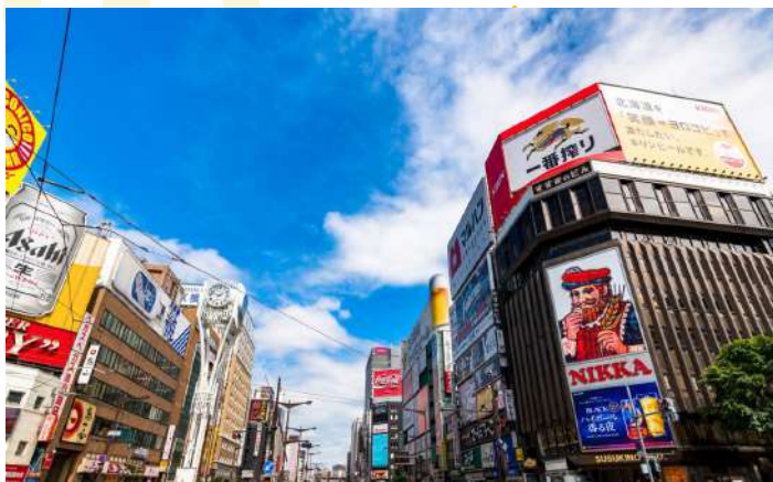
SHOPPING AT SUSUKINO

อิสระอาหารค่ำตามอัธยาศัย (ไม่รวมในรายการ)