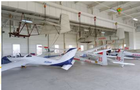
TAKIKAWA SKY PARK MUSEUM