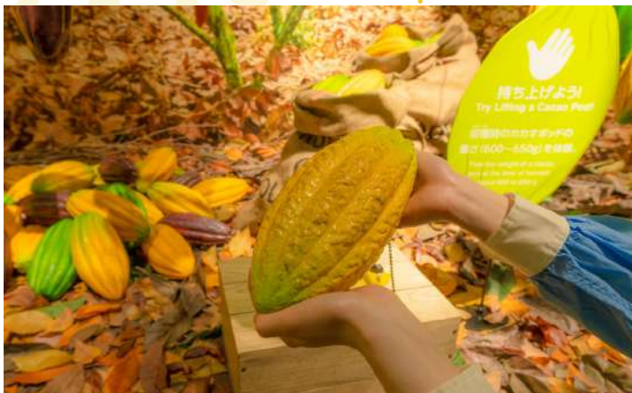
ROYCE CACAO & CHOCOLATE TOWN