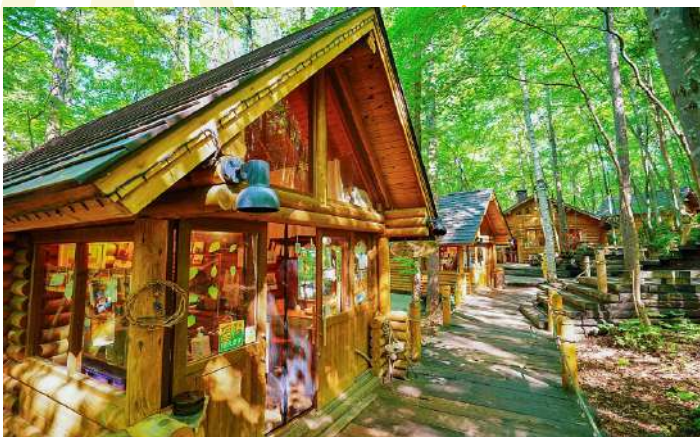
FURANO NINGLE TERRACE