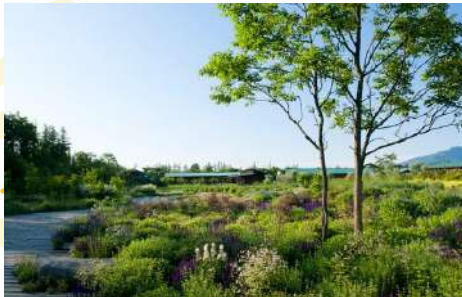
TOKACHI MILLENNIUM FOREST