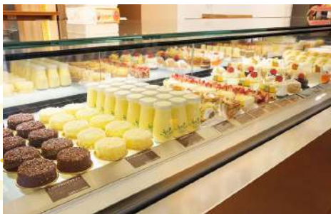
FURANO DELICE CAFE