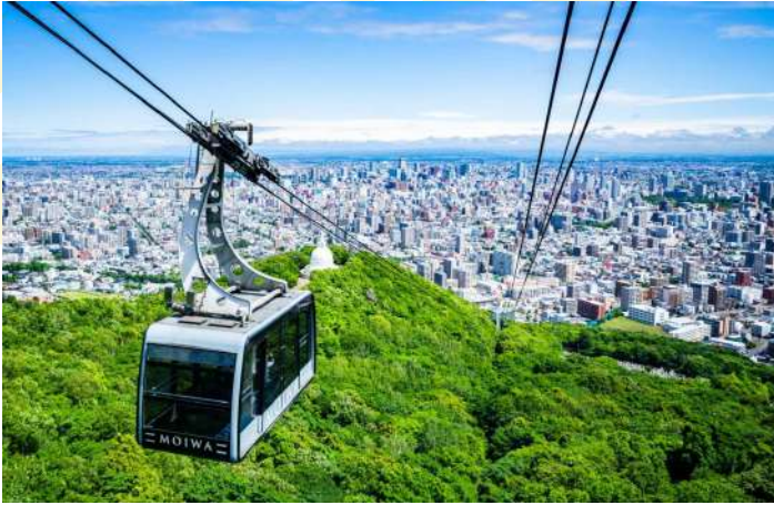
MT.MOIWA (CABLE CAR)