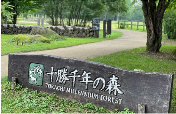
TOKACHI MILLENNIUM FOREST