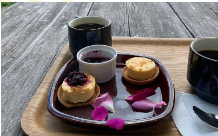
TOKACHI MILLENNIUM FOREST