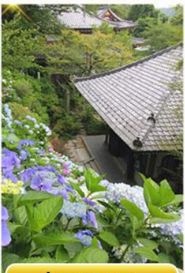
วัดอาซากุระ