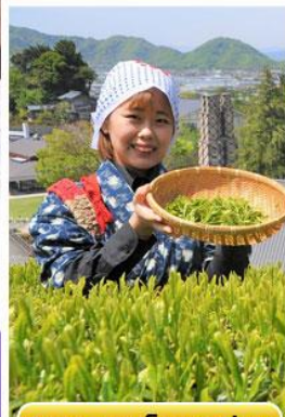
กิจกรรมเก็บชาเขียว