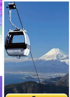
อิซุพานอรามาวิว

ออนเซ็น 1 คั้น นน.กระเป๋า 23 กก. 7Days 4Night