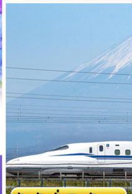
สัมปั่งนั่งชินคันเซน