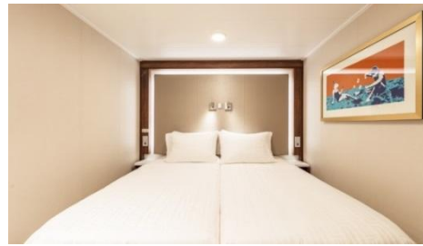
พัก 1-2 ท่าน

/ 1 Single Bed + 1 Pullman Bed + 1 Double Sofa Bed