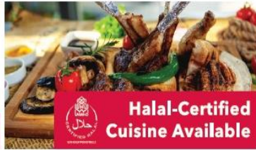
Halal-Certified Cuisine Available