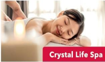
Crystal Life Spa