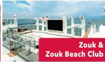
Zouk &amp; Zouk Beach Club