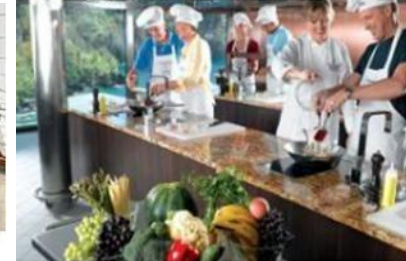
THE CULINARY CENTER