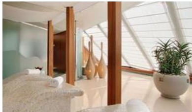
AQUAMAR SPA+ VITALITY CENTER