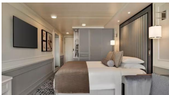
DELUXE OCEANVIEW (22 SQM.)