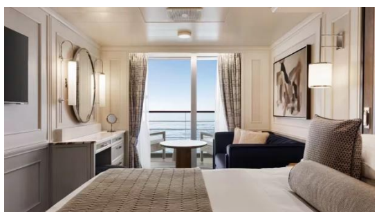
VERANDA STATEROOM (27 SQM.)