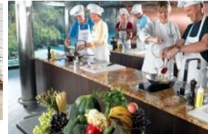
THE CULINARY CENTER