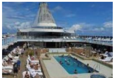
RELAX BY THE POOL