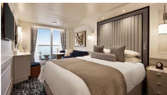
CONCIERGE LEVEL VERANDA (27 SQM.)