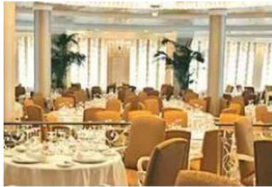
THE FINEST CUISINE AT SEA®