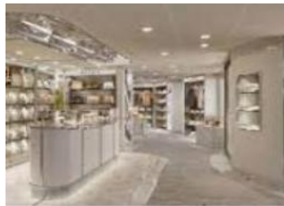
BOUTIQUES &amp; MORE