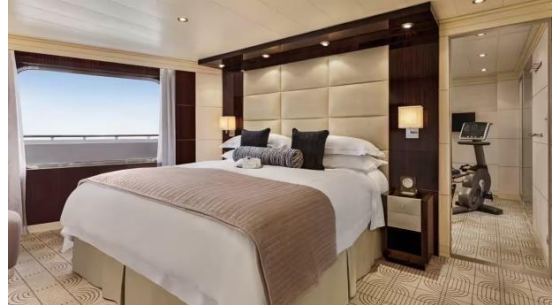
VISTA SUITE (111-139 SQM.)