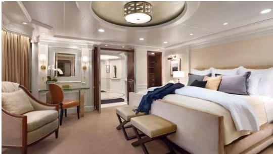
OWNER'S SUITE (185 SQM.)