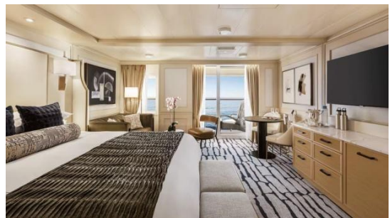
PENTHOUSE SUITE (40 SQM.)