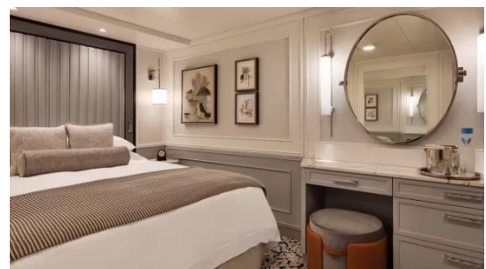
INSIDE STATEROOM (17 SQM.)