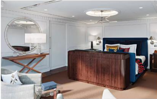
OWNER'S SUITE (223 SQM.)