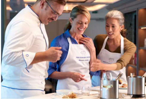
LEARN BY EXPERIENCING