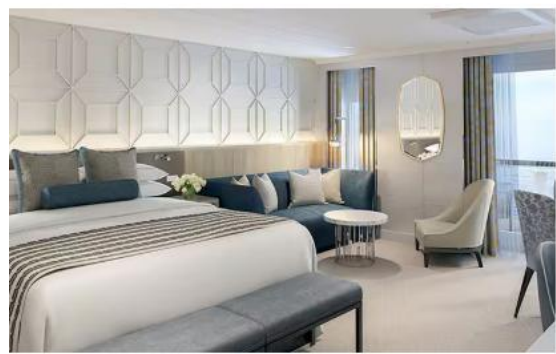
PENTHOUSE SUITE (41 SQM.)