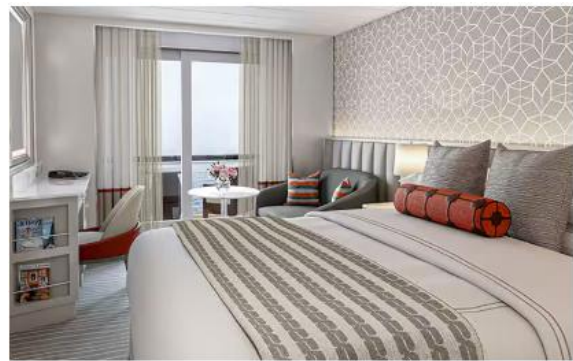
VERANDA STATEROOM (27 SQM.)