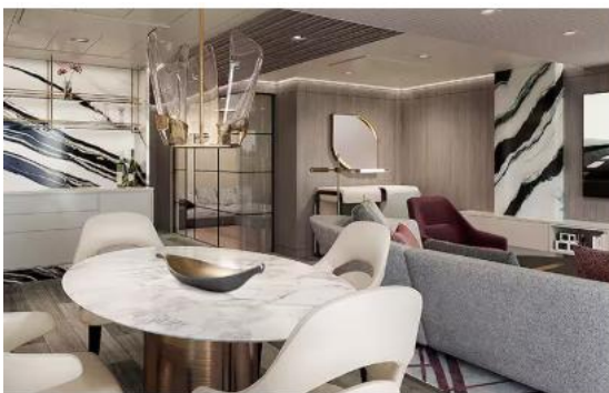
OCEANIA SUITE (89-109 SQM.)