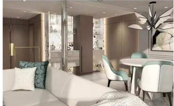
VISTA SUITE (161-171 SQM.)