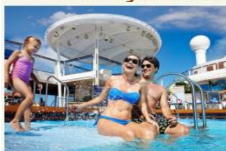
สระว่ายน้ำ