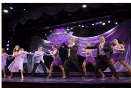
The Royal Theater

-Silk Road Two 70 ชั้น 5 ท้ายเรือมีโชว์วันละ 1 รอบ ต้องทำจองล่วงหน้าเนื่องจากที่นั่งจำกัด