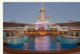
Outdoor Mivie Night